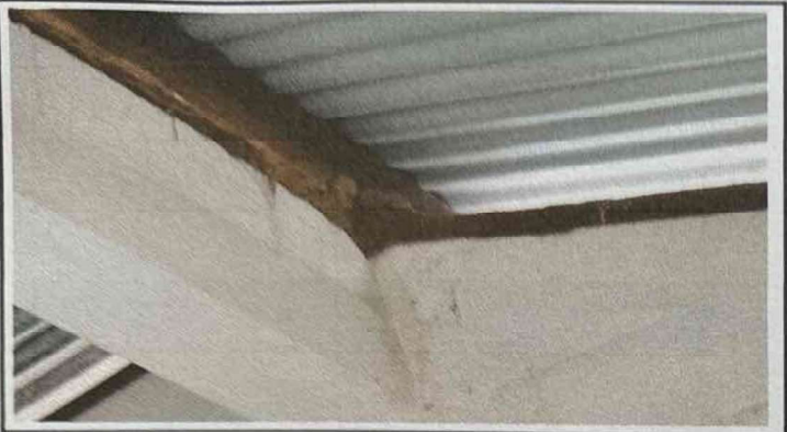
Foto1: Sustrucion de carga lamina por costanera